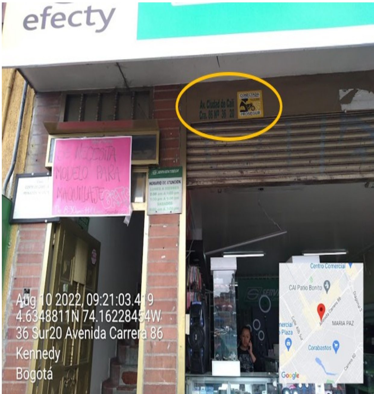
Nomenclatura del predio en el que se sitúa el establecimiento comercial denominado ESCUELA DE BELLEZA D' ITALO , ubicado en la AK 86 No. 36 – 20 SUR .